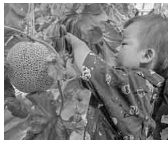
上手に切れるかなあ～

六月十四日、私たちはメロン狩りと竜ヶ岩洞ウォーキング、そして浜名湖バイキングを楽しみ日帰り旅行に参加しました。 朝八時にJR岡崎駅西口を出発し、続いて名鉄東岡崎駅南口から参加者を乗せて、目的地である静岡県浜松方面へ向かいました。バスの車内では参加者同士の会話も弾み、楽しい一日の始まりに期待が高まりました。