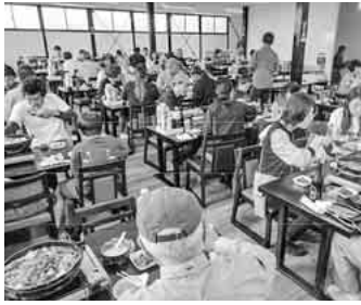
参加者そろって楽しく昼食