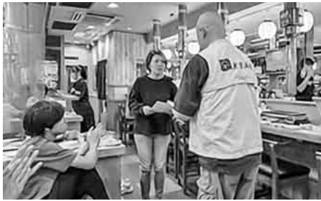
役員家族会の様子

六月六日に新たに班長さんサポーターになった方々、いただいた方々の歓迎会と、役員・班長の活動に協力いただいたご家族との親睦を深めるため、津島市にある「にくのくに」にて食事会を行いました。 皆さんが楽しそうに歓談されていたので、これからこういった機会を増やしていきたいと思いました。 組合活動に興味がある方、いつでも班長サポーター募集しますので、ご連絡お願い致します。