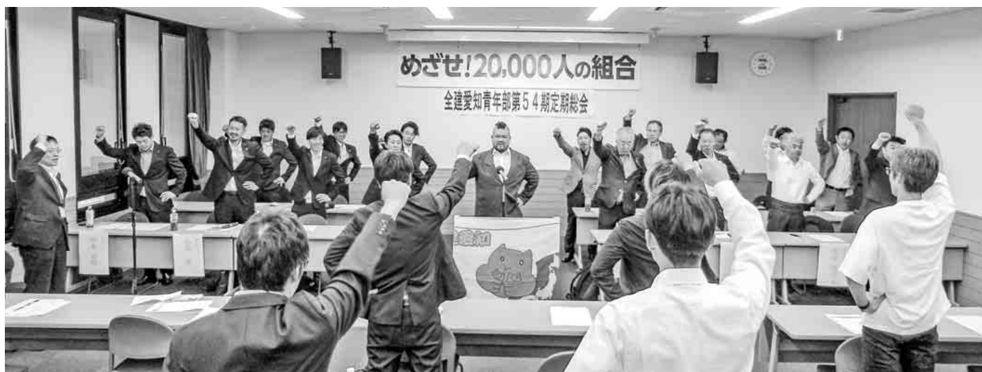
「団結ガンパロー」で気持ちを1つに