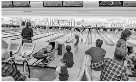
熱気にあふれた会場

当日外は雪が降っていましたが、ボウリング場は参加していた皆さんの熱気にあふれた会場