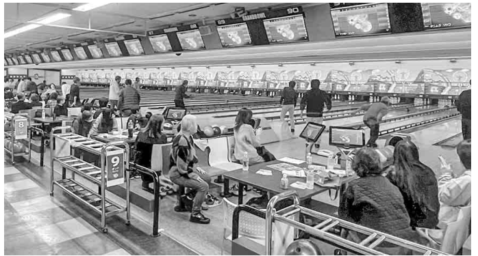
大いに盛り上がった会場