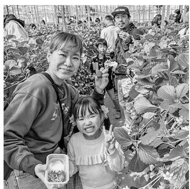
家族みんなでイチゴ狩り