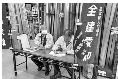
組織拡大行動の様子

南支部は二月七日(土)十時から、名古屋市南区コーナンPRO宝生店にて古橋支部長の元、班長三名