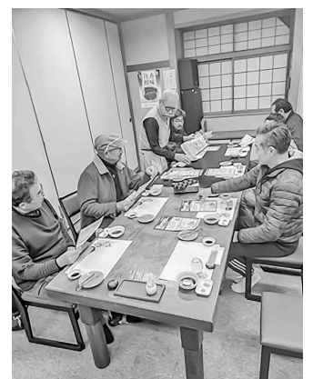
熱心に説明を聞く参加者

を行いました。その後石綿含有物の解体に関する勉強会を開きました。間が長いこと、建設業にかかわっている皆さんは注意が必要との説明と、これから増改築、解体