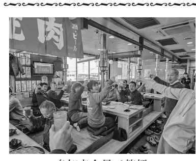
参加者全員で乾杯