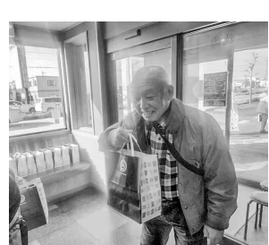
お土産をもらい笑顔の参加者

今年からスタートした津島壮年部。その記念すべき第一回目の親年会が開催されました。 事前の案内ハガキで四十一歳以上の組合員に参加を募り、当日は合計三十名が参加しました。