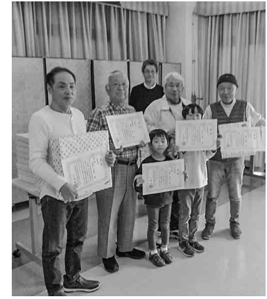
賞品を手に記念撮影

ゲームでは、ストライクが出てハイタッチを交わしたり、惜しいスプリットに全員で悔しがったりと、会場は大いに盛り上がりま