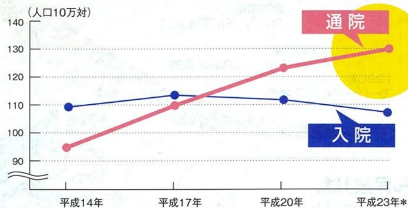
■がん(悪性新生物)の外来受療率・入院受療率の推移