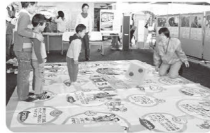
防災すごろくゲーム

遊びながら、災害時の知恵や工夫を学ぶことが出来る「防災すごろく」を 一緒にやりましょう。飛び入り大歓迎! 楽しく遊んで賞品をゲットしよう!