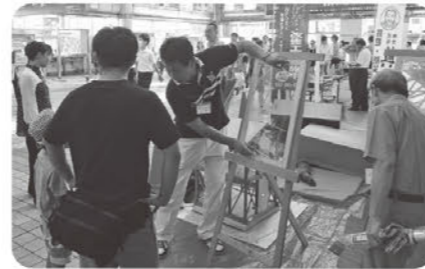
ガラス飛散防止フィルム貼り実技指導